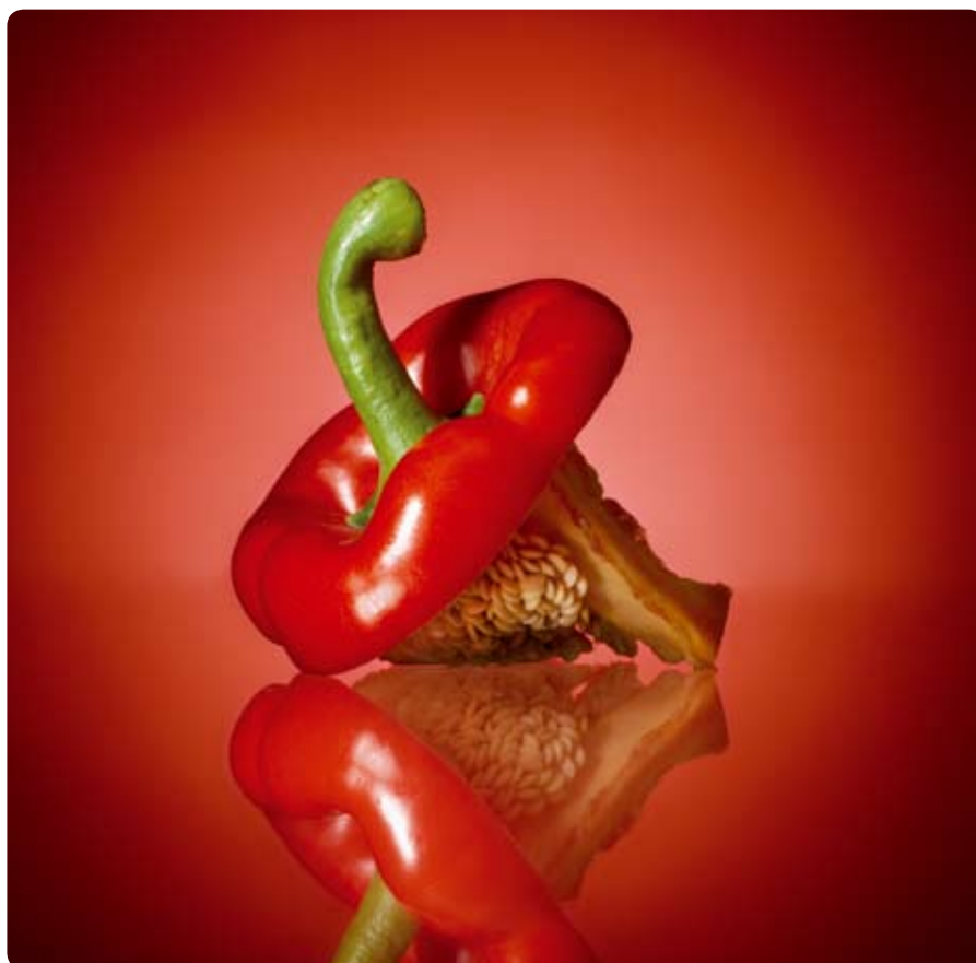
BLOMQUIST ANNONSRAMA